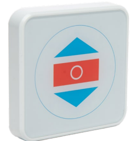
Touchless Taster Art.: 512.TLR3.00