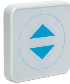
Touchless Taster Art.: 512.TLR2.00