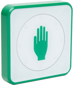
Touchless Taster Art.: 512.TLR1.00 PNP/NPN 512.TLT1.00