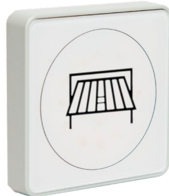
Touchless Taster Art.: 512.TLR1.01 PNP/NPN 512.TLT1.01