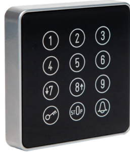
Cody Touch-Silber-Schwarz LED-Blau Art.: 507.BT21.03