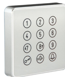
Cody Touch-White LED-White Ref.: 507.BT21.01