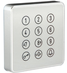
Cody Touch-Weiß LED-Weiß Art.: 507.BT21.01