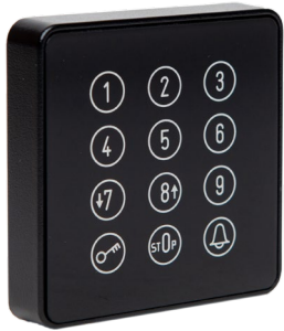
Cody Touch-Schwarz LED-Blau Art.: 507.BT21.00