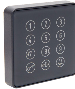
Cody Touch-Anthrazit LED-Blau Art.: 507.BT21.02